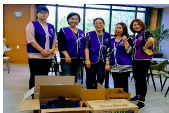
5월 30일 해양여수지부 회원들