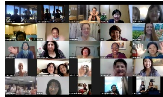
5월 9일 화상으로 참석한 여성지도자들