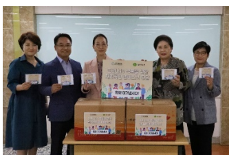
5월 8일 면마스크 지원 전달식

지난 5월 9일 세계평화여성연합 세계본부 주관하에 문선진 수석부회장과 함께하는 미국 어머니의 날 특별행사 'Food is Love and Life (밥은 사랑이자 생명이다)'가 전 세계 여성연합 지도자 100명이 참석한 가운데 개최되었다. 이 특별행사는 문선진 수석부회장이 한학자 총재가 즐겨 드시는 식사를 화상으로 요리하며 진행되었으며, 각 대륙에서 한 명씩 추천 받아 'Super Moms'를 선발하여 어머니들을 격려하고 기념하는 시간을 가졌다. 'Super Moms'은 지역사회에서 모범적으로 활동하고 있는 여성연합 지도자 10명 (각 대륙에서 1명씩)으로, 선발된 이들에게는 특별 선물이 증정되었다. 행사에서 문선진 수석부회장은 "문선명 한학자 총재 양위분께서 모임을 가진 뒤 늘 맛있는 음식을 마련해 주시는 것처럼, 여기에 계시는 모두가 이 어려운 시기에도 두 분의 사랑을 느끼시고, 이 전통을 계속 해서 이어 나갈 수 있으면 좋겠습니다."라는 메시지를 참석자들에게 전했다.