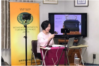
5월 30일 일본 여성연합 온라인 경매