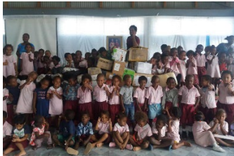
오세아니아 여성연합 지역 학교 물품 기부