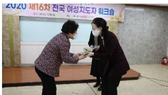
12 월 8 일 공로패 수여