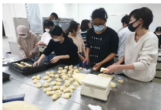
3월 27일 봉사활동 중

4월 17일 오후 6시 30분부터 줌을 통해 한국과 일본의 2030 세대 여성지도자들이 '세계 평화'를 주제로 한일 유스토크 국제교류 평화포럼을 개최하였다. 이날 행사는 한국 여성연합의 2030 세대로 결성된 더미래팀과 일본 여성연합의 유스팀이 공동주최로 전체 50여명이 참여한 가운데 진행되었다. 한국과 일본의 대표자들이 순차로 사회를 보며 행사의 막이 열렸으며, 문훈숙 세계회장의 인사말, 여성연합 소개, 언어별 소그룹 모임, 소감공유의 순으로 진행되었다.