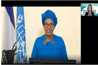
3월 19일 레소토 왕국 영부인의 환영사