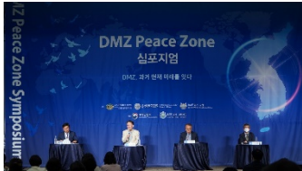
7월 1일 발제 및 토론