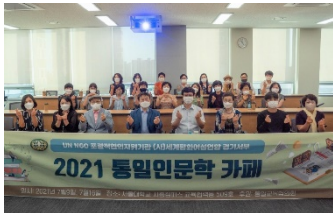
7월 9일 참석자 단체사진

경기서부지부는 7 월 9 일과 16 일 '2021 통일인문학카페'를 서울대학교 시흥캠퍼스 교육협력동 509 호 대회의실에서 개최하였다. 금번 행사는 코로나 19 방역지침을 준수한 가운데 30 여명의 지도자가 참석했다. 참가자는 "드라마 '사랑의 불시착' 중 마을에서 전기가 나가는 장면을 처음 봤을 때 연출인 줄 알았는데, 실제로 북한에서 일어나는 상황을 묘사한 것임을 알았다. 민주주의 사회에서 전기는 일상 속에 익숙한 존재이다. 익숙함에 소중함을 잊지 말자는 말을 다시 한번 되새기는 시간이 되었다"고 소감을 남겼다.