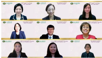
8월 18일 발제자 단체사진

세계평화여성연합과 유엔한국협회는 남북한 유엔 동시 가입 30 주년, 한국전쟁 발발 71 년을 맞아 분단의 상징인 DMZ 의 활용방안을 모색하기 위해 'DMZ, 과거 현재 미래를 잇다'라는 주제로 경기·강원권 DMZ Peace Zone 심포지엄을 7 월 1 일 여주썬밸리호텔 그랜드볼룸에서 개최했다. 행사는 개회식으로 시작하여 국민의례, 환영사, 인사말, 축사, 주제발표의 순으로 진행되었다.